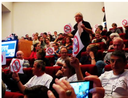
Jouy en Josas